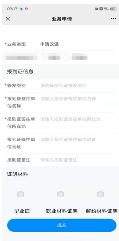
图 4 学生端改派填写图例

学生在提交时务必勾选正确的“ 办理业务类型 ”（可根据下表判定应属类型）、上传派遣事项对应的相关材料。上报成功后，等待学校审核（图 4 以改派报到证页面为例）。