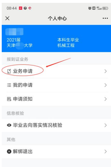
图 3 学生端发起图例

学生在提交时务必勾选正确的“ 办理业务类型 ”（可根据下表判定应属类型）、上传派遣事项对应的相关材料。上报成功后，等待学校审核（图 4 以改派报到证页面为例）。