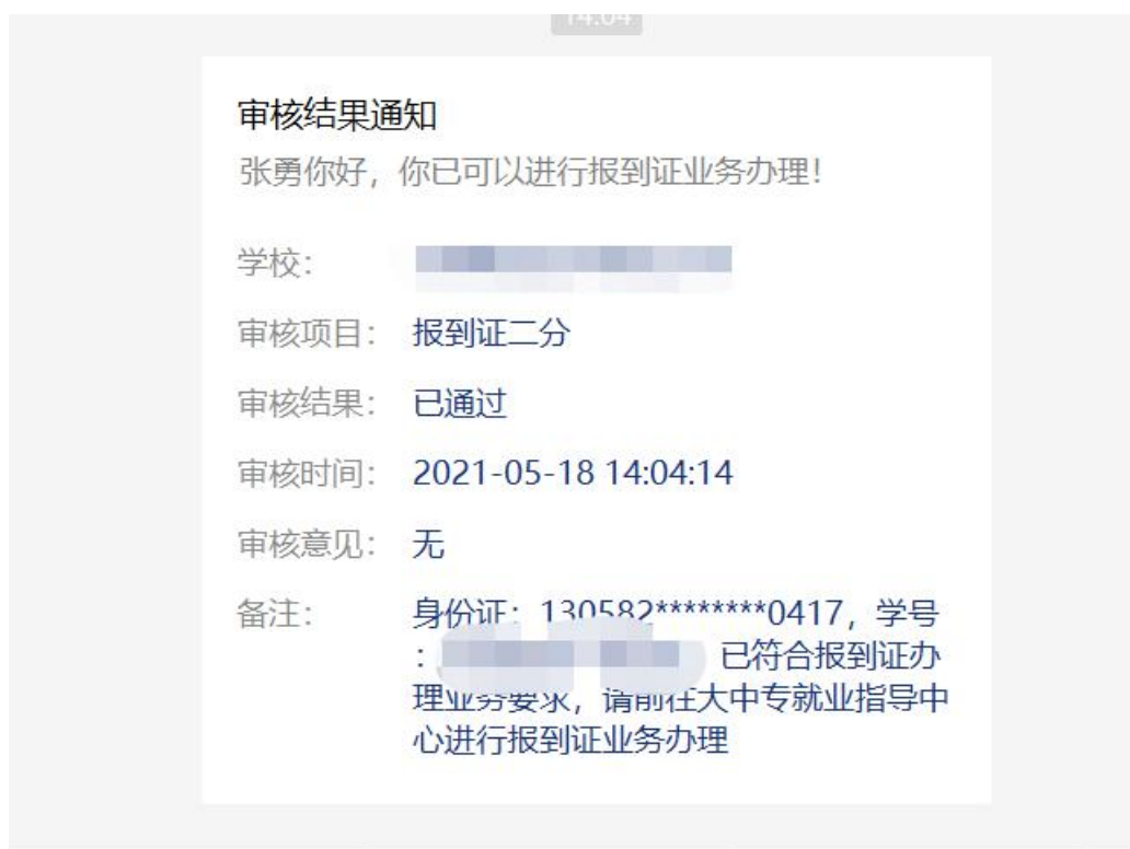
图 5 学生收到的反馈信息